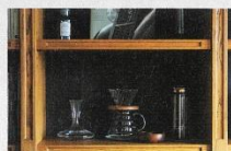
オーガーマイドの本棚には、趣味のコーヒーセットを飾るスペースを