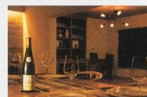
ワインや料理がおいしくなるように照明を調整した。柔らかな雰囲気のあるダイニング

湘南・横須賀・横浜で、不動産を中心とした総合生活提案を行う（ミック）グループのリフォーム・リノベーション専門部門「Rスタジオ（アールスタジオ）」。「小さなリフォームからフルリノベーションまで、年間約600件の施工実績を持つ。グループ力を生かし、中古物件探しからプランニング、施工、アフターサービスまで生進にわたってサポート。狭倉店では欧州デザインを得意とするクリエイターが在籍し、洗練されたデザインのオーガーマイド・リノベーションを計ってくれる。