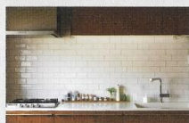
キッチンの壁にサブウェイタイルを用いて、シンプルなかにも華やかさを付けた