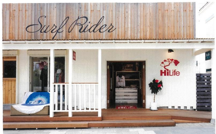
鎌倉市由比ヶ浜2-22-11-1F Tel.0467-55-5913 営業時間:10:00~18:00 定休日:水曜(変更あり)

ハワイ生まれのローカル・アパレルブランド 「HiLife」のショップが由比ヶ浜にオープン