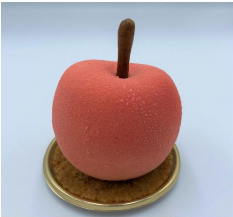
リンゴとキャラメルムースの「ボム」

三春情報センター（横浜市港南区）のグループ会社、スマイルダイニング（同） は、運営する洋菓子店「パティスリー雪乃下」の神奈川県内6店舗で、秋限定の新商 品4種を販売している。