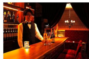
中区福富町に会員制ワインバー 「VINO (ヴィーノ)」 年内はVIP会 員体験も