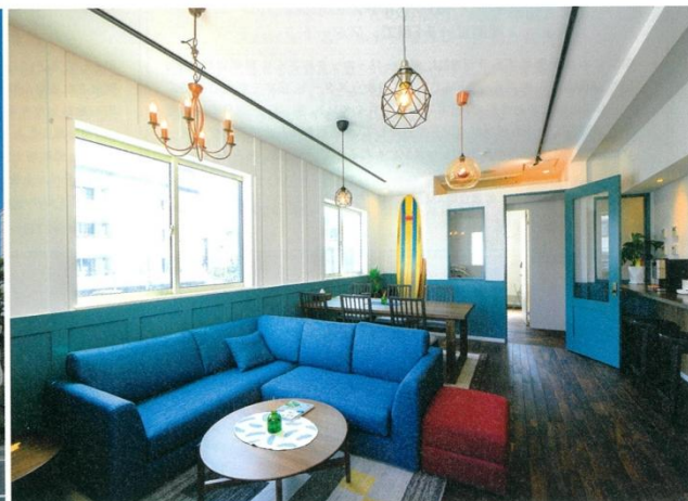
共用リビングは、無垢の床と白い壁の西海岸風。素材やカラー、照明もコーディネートされたおしゃれな空間

湘南・横浜を中心に、住まいと暮らしに関わる事業を展開するmic三春情報センターが、鎌倉・由比ヶ浜に簡易宿泊施設「B&B Surf Rider」をオープンした。由比ヶ浜海岸から徒歩1分の若宮大路沿いで、JR鎌倉駅へも歩いて10分ほど。鎌倉の街と海を満喫する絶好の場所だ。外観はナチュラルな木の外壁で、2階フロアが宿泊施設。客室は2人部屋が4室、4人部屋が1室の全5室。ゆったりとした共用リビングルームと簡易キッチン、広いシャワールームが併設されている。デザインは西海岸風で、インテリアにもこだわり、リゾート気分たっぷり。宿泊料金は季節によって異なるが、基本料金は4人部屋で1人4900円から。朝食は、1階にあるカフェ「モアナ」で軽食が提供される。 鎌倉は観光客が多いが、気軽に宿泊できる施設が意外に少ない。こうした背景とインバウンド宿泊のニーズに応え、mic三春情報センターでは今後も鎌倉に簡易宿泊施設を展開していく予定。住まいづくりを手がける企業のプロジェクトだからこそ、居心地のいい空間づくりにはこだわりがある。鎌倉をじっくり散策するのも、ここを拠点に足を延ばすのもいい。気軽に快適に、鎌倉ステイを楽しんでみては。