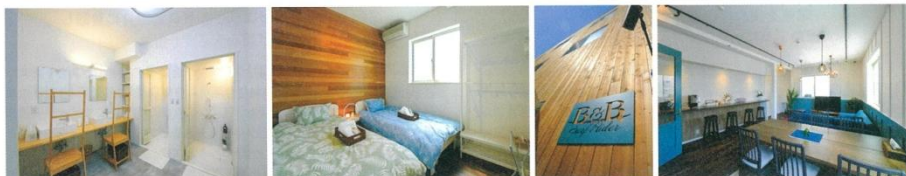
男女別のシャワールーム、くつろげる客室、自由に使えるリビング・ダイニングと、快適に過ごすための気配りが随所に

湘南・横浜を中心に、住まいと暮らしに関わる事業を展開するmic三春情報センターが、鎌倉・由比ヶ浜に簡易宿泊施設「B&B Surf Rider」をオープンした。由比ヶ浜海岸から徒歩1分の若宮大路沿いで、JR鎌倉駅へも歩いて10分ほど。鎌倉の街と海を満喫する絶好の場所だ。外観はナチュラルな木の外壁で、2階フロアが宿泊施設。客室は2人部屋が4室、4人部屋が1室の全5室。ゆったりとした共用リビングルームと簡易キッチン、広いシャワールームが併設されている。デザインは西海岸風で、インテリアにもこだわり、リゾート気分たっぷり。宿泊料金は季節によって異なるが、基本料金は4人部屋で1人4900円から。朝食は、1階にあるカフェ「モアナ」で軽食が提供される。 鎌倉は観光客が多いが、気軽に宿泊できる施設が意外に少ない。こうした背景とインバウンド宿泊のニーズに応え、mic三春情報センターでは今後も鎌倉に簡易宿泊施設を展開していく予定。住まいづくりを手がける企業のプロジェクトだからこそ、居心地のいい空間づくりにはこだわりがある。鎌倉をじっくり散策するのも、ここを拠点に足を延ばすのもいい。気軽に快適に、鎌倉ステイを楽しんでみては。