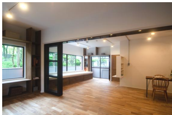
▲開放感のある室内(収納含めて約 29.3 帖)

古い間取りを全て解体し、湘南の建築スタイルにモダンなテイストをプラスした明るく開放的な空間に設計し直しています。回遊型ウォークインクローゼットのある機能的な居室や、座面が開閉式となっている大容量の収納を兼ねた造作ベンチは、窓際に設置することでソファとしての役割だけではなく、昼寝や読書など、家族それぞれが自分の好きなように使うことができます。