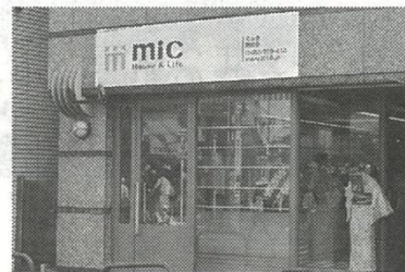
▶「ミック鎌倉店」の外観

三春情報センター 約1900戸を管理する三春情報センター(神奈川県横浜市)は、1日に「ミック鎌倉店」をJR横須賀線「鎌倉」駅西