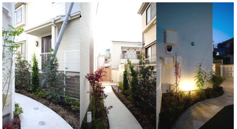
▲照明や植栽でアプローチを演出