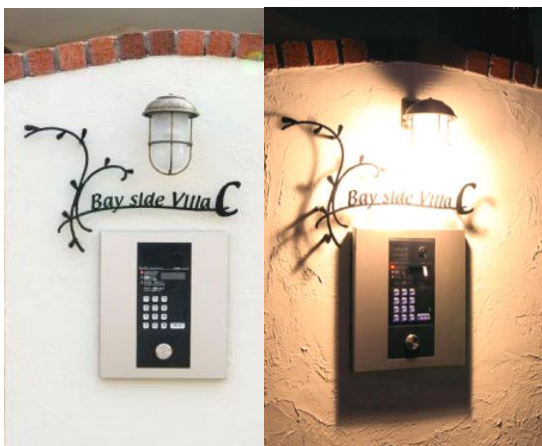
▲オシャレなアイアン表札