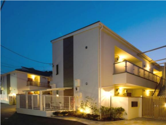
▲ベイサイドヴィラ(全3棟)

相続した土地を手放さず有効活用したい ▶ 諸問題を不動産会社が解決 ▶ オーナー様の思いを込めたアパートを実現