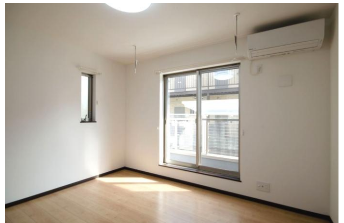
▲南向きでシンプルな居室