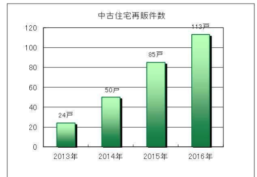
▲中古住宅再販件数グラフ

不動産売買賃貸仲介を主軸とし、リフォーム・建築・賃貸管理などを行うミックでは、2005年に買取再販事業である、株式会社ミックライフプロデュースを設立し、若者の転出や高齢化による空き家の増加から地域の空洞化を防ぐため、売りたいお客様のニーズを叶え、自社リフォーム・リノベーションで再生させ、購入したいお客様のニーズに応じてきました。その結果、地域にお客様の循環が生まれ、再生販売の循環型事業として伸びてきたと考えています。