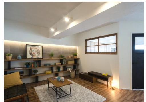
▲リノベーションモデルルーム

地域密着で地域と共に発展していきたいと考えているミックでは、これまでの不動産取引やリフォーム取引のノウハウを生かし、買取物件をただリフォームして販売するのではなく、物件ごとにテーマを持たせ、より魅力的で満足度の高い「コンセプトリノベ」でオリジナルの住宅を提供しています。リノベーションにより価値向上したミックの物件がお客様に選ばれ、ここ数年は、買取件数・リノベーション件数・再販件数共に増加しています。