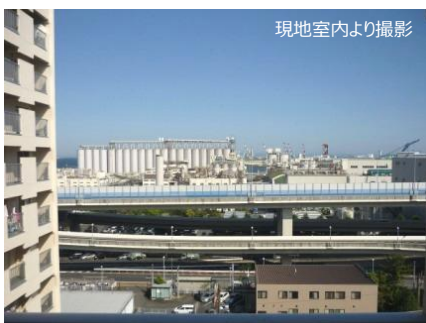
現地室内より撮影