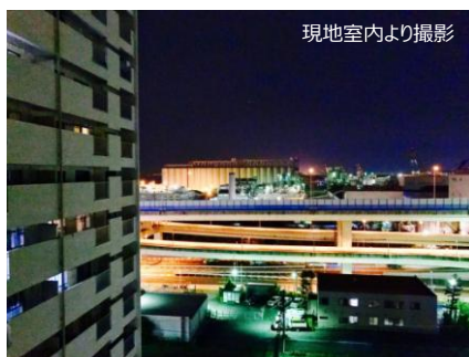
現地室内より撮影