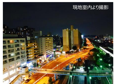
現地室内より撮影