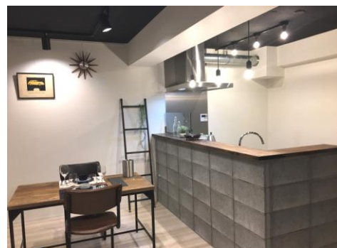
▲ダイニング・キッチン

磯子駅周辺は駅を中心に、海側に京浜工業地帯、反対側に丘陵地帯が広がり、築40年を超える分譲マンションが多く立ち並ぶ、ミックの主要商圏エリアの1つです。（現在までに磯子区森1.2丁目・磯子3丁目の売買賃貸仲介及びリフォームお取り引き件数は約320件。）