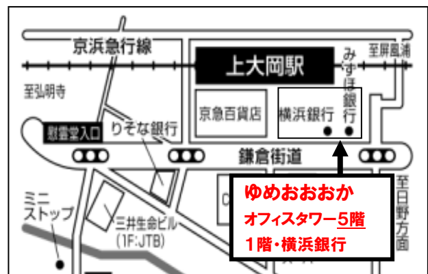
【セミナー会場案内図】