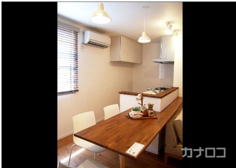
三春情報センターが磯子区に新設したリフォームのショールーム

不動産仲介などを手がける「ミック」グループの三春情報センター(横浜市港南区)は、本年度からリフォーム事業「アールスタジオ」のショールームを2拠点に増やし、リノベーション(大規模改修)も含めた顧客への提案を強化する。