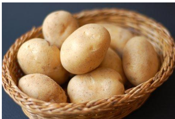
▲新鮮採れたての男爵いも

お取り引きいただいてからがお客様との真のお付き合いと考えるミックでは、アフターサービスを大切にしており、年間を通して様々なコミュニケーションを取っております。当企画はその一環としてお客様の暮らしに彩りを与えられる2年に1回のプレゼントとして、旬の味覚である北海道の羊蹄山付近で収穫されたブランドじゃがいもをお届けしました。