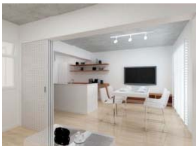
ホワイト・クール：全体的に純白で仕上げ、ガラスやシルバーなどのアクセントで「クール」を演出。

デザイン投票は、総務部、商販部、同社の全社員が対象。上永谷店、港南倉庫前店、本社営業部、「スタジオテラ・カーサ」、「レストランテラ・カーサ」等の店舗で投票を実施する。投票期間は、2015年10月22日（木）～11月4日（水）の14日間。決選デザインへ投票した方の中から、抽選で3名に各人1万円の商品券を用意している。