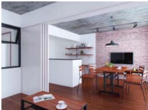
ブルックリン・カフェ：味わい深い「カフェ風」スタイル。ヴィンテージ家具が特徴のレトロな雰囲気。